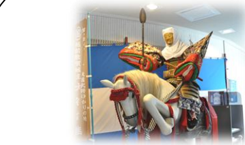
1 みなとつるが山車台館